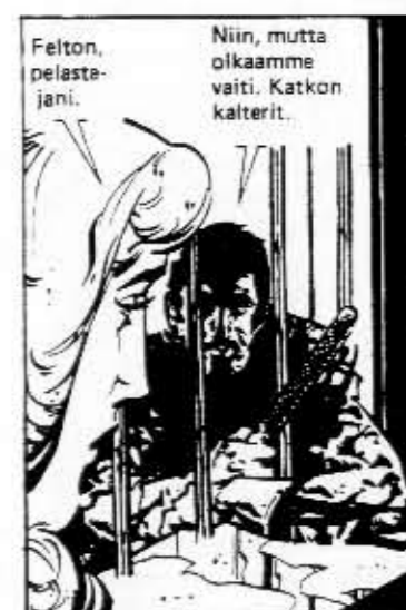
Gilbertonin ja Pendulum Press'n Muskettisoturi -versiot muistuttavat melkoisesti toisiaan...