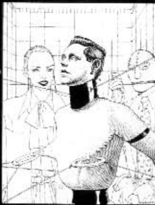
Moebius & Jodorowsky: Enkelikynsi SÖTEM, 1997

Että näinkin mielenkintoisesta aiheesta voidaan tehdä lämmin tekotaiteellinen kuvakirja katseluuntoisille. Jos s/m- ja alistusleikit ja lävistykset halutaan verhoata tekofilosofisen hölynpölyn ja eroottisen pöytälaatikkorouhuden kaapuun, mikäs siinä. Mutta etsimättä tulee mieleen, että William Burroughsillakin oli herätyskelloja yöpöydällä soimassa vähän väliä, unenpöpperössä hän sitten kirjoitti unensa (omenakairoista ja sen semmoisista) muistiin. Ennenmin selaan vaikka RE/SEARCHIN uudelleenjulkaiseman "Modern Primitivesin" harmaita valokuvia, kuin katselen näitä sinänsä hyvinkin näppärästi ja kauniisti piirrettyjä irrallisia taideteoksia, jotka on väkisin nivottu yhteen kirjaksi. Tietysti, jos saat kicksiä nimenomaan piirteistä kuvista, mikäs siinä. Mutta jos tekijät haluavat kertoa jonkin oman fantasiansa pikkupiirteittäin, ollaan samalla saralla kuin Emmanuelle Arsan, joka kaukoidän helteessä kirjoitti unelmistaan cepesta. Tyksää.