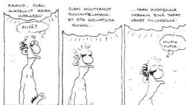
Ralf König: Kermaleivoksia LIKE, 1997

Ralf König on eräs nykyaikaisen hauskeimmista satiirikoista. Kermaleivoksissa käydään taas totuttuun tapaan lyhyinä episodeina gay-arjen kommenteja, lisäksi mukana on liikuttava(?) ritari-