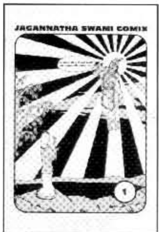
Jagannatha Swami Comics #1

Harc Krishna -oppia yksinkertaisesti selitettynä. Menossa mukana muutama varastettu hahmo kuten Aku, Mikki, Sepe Susi sekä Kapteeni Koukku, Helikeiju ja Simo Disneyn Peter Panista. Kuulosti silti tyhmältä. Ken pitää, se lukee.